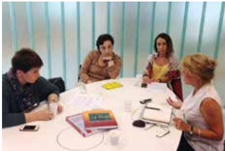
სასწავლო ვიზიტი ჰოლანდიაში

ჰოლანდიაში ვიზიტის დროს ექიმები გაეცნენ სამი წამყვანი ბავშვთა ჰოსპისის და შინ ზრუნვის სამსახურის მუშაობას, ასევე გაიარეს ინტენსიური კურსი ბავშვთა პალიატიური მზრუნველობაში.