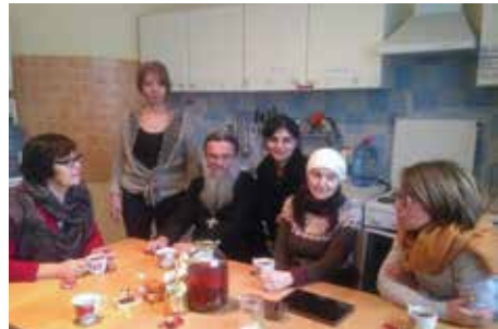
ექთნების სასწავლო ვიზიტი მინსკის ბავშვთა ჰოსპისში

ესპანეთში, ქ. მადრიდში, ექიმებმა მოინახულეს ბავშვთა პალიატიური მზრუნველობის განყოფილება წმინდა ნინოს სახელობის საუნივერსიტეტო ჰოსპიტალში და შეისწავლეს შინ ზრუნვის სამსახურის სპეციფიკა.