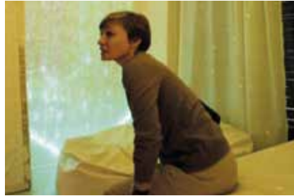
პირველი ლედი მაკა ჩიჩუა გერმანიის ბავშვთა ჰოსპისში